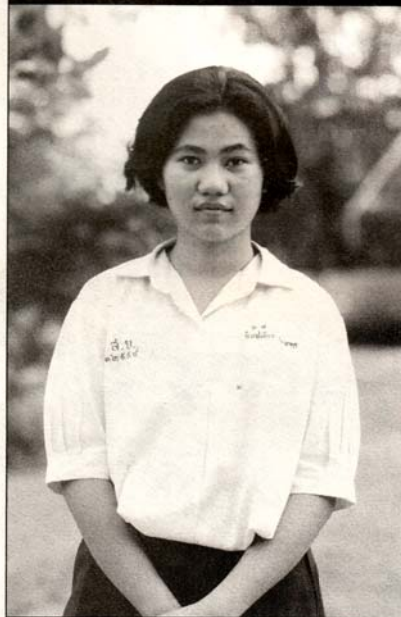
พิมพ์เดือน ตุงคะนาค